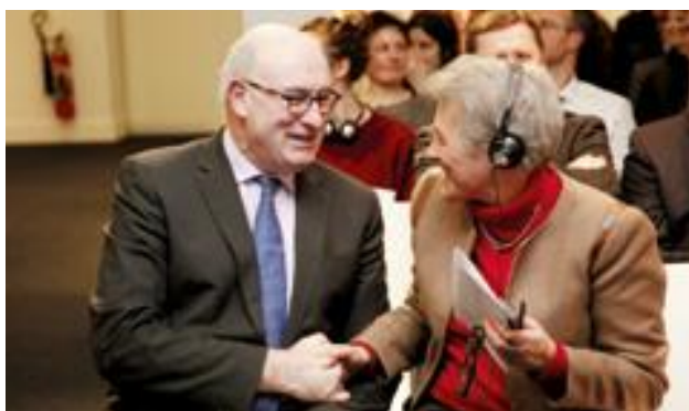
Komisarz EU Phil Hogan z zastępcą sekretarza generalnego EDA Bénédicte Masure

Ilości do 29 stycznia 2017 są następujące: