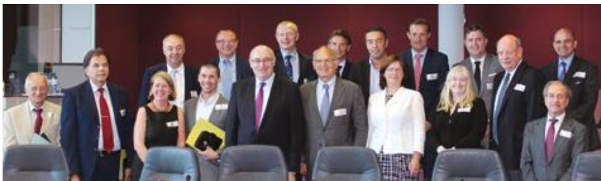
Spotkanie Zarządu EDA z Komisarzem UE Philem Hoganem w sali François-Xavier Ortoli w budynku Berlaymont w Brussels, July 2016